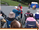
青葉太鼓の方々に よる太鼓演奏